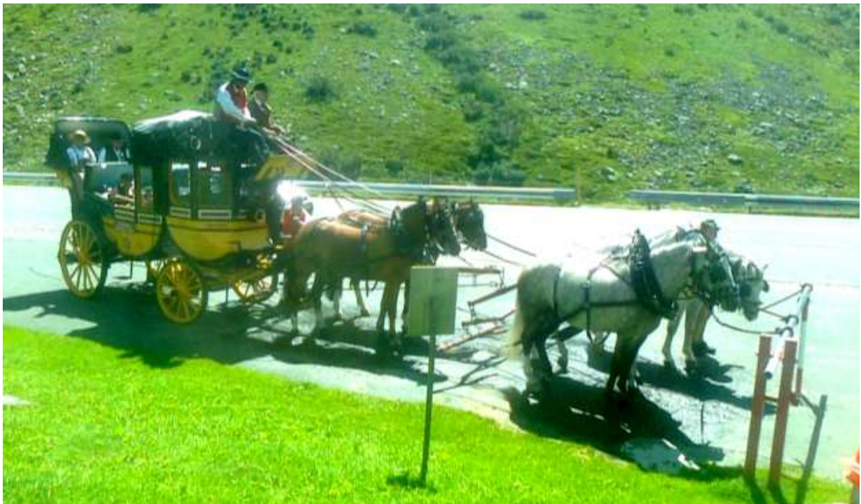
Impression von der Gotthardpostfahrt Abschiedsgeschenk Ueli Maurer